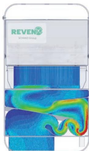
CFD-Bild 1: Strömungssimulation

Bei der Optimierung der Abscheidung setzt Rentschler REVEN CFD-Technologie zur Analyse des Strömungsverhaltens ein, um einen optimalen Abscheidegrad bei der Reinigung der Abluft von Industriemaschinen zu erreichen. Das Strömungsverhalten wird im Computer simuliert und das Design des Filtergeräts immer wieder angepasst, bis der bestmögliche Abscheidegrad für Schmutzpartikel erreicht ist.